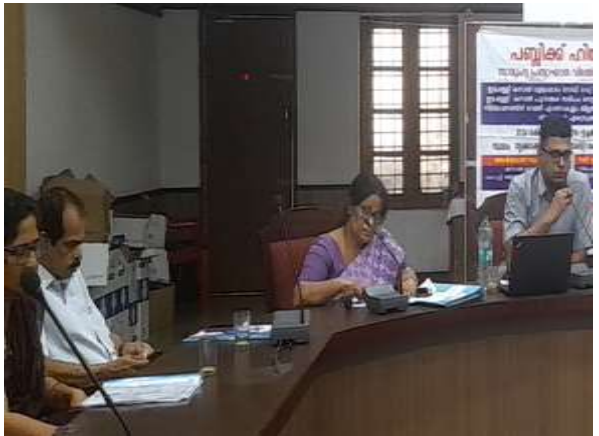
ഇൻറഗ്രേറ്റഡ് അർബൻ റീജനറേഷൻ & വാട്ടർ ട്രാൻസ്പോർട്ട് സിസ്റ്റം പദ്ധതി - ഇടപ്പള്ളി കനാൽ (പുനരവകാശ സമീപം) വെറ്റ്വെൽ പമ്പിങ്ങ് സ്റ്റേഷൻ നിർമ്മാണത്തിനായി ഭൂമി ഏറ്റെടുക്കൽ